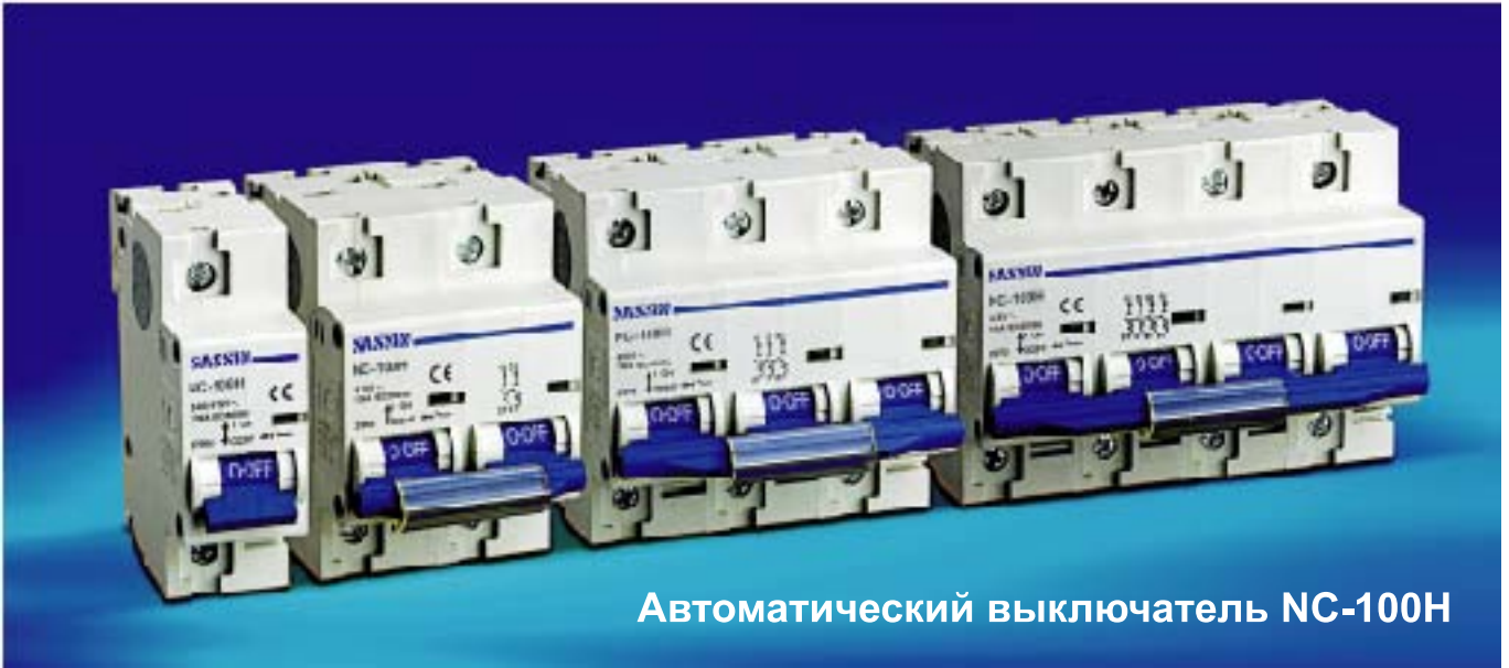
Автоматический выключатель NC-100H