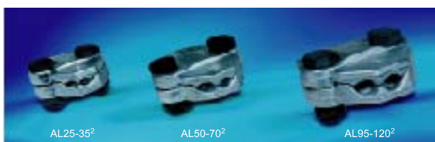
клемма алюминиевая, усиленная